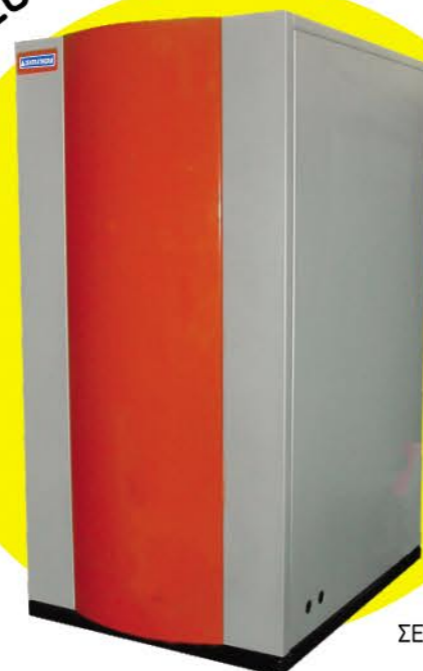
ΣΕΙΡΑ X DESIGN

Οι αυτόνομες μονάδες ατομικής θέρμανσης ZENTRATHERM, αποτελούνται από: